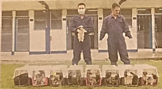
ANGGOTA Maqis menunjukkan sebahagian daripada 23 anjing pelbagai baka yang dirampas di ICQS Pengkalan Hulu semalam.