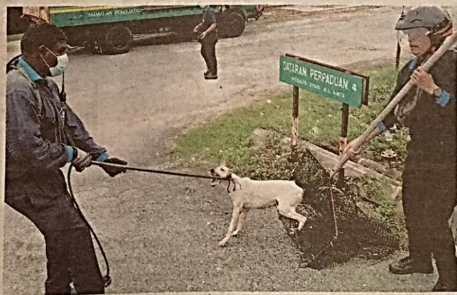
PENGUAT kuasa MBI menangkap salah seekor anjing liar dalam operasi yang dijalankan di tiga kawasan perumahan di Tambun, Ipoh baru-baru ini.

Ekoran kecederaan itu, kos rawatan sebanyak RM30,000 diperlukan bagi menjalani rawatan susulan di hospital.